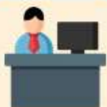
เจ้าหน้าที่บันทึกข้อมูล