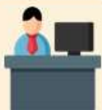
เจ้าหน้าที่บันทึกข้อมูล