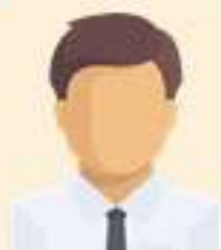
เจ้าหน้าที่