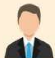
ประมงจังหวัด