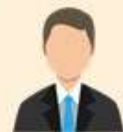
ประมงจังหวัด